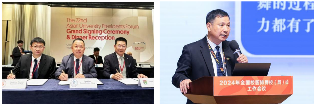
图 3 我校校长、书记进行成果推广与交流

的特色人才。成果在广州城市职业学院、广东科学技术职业学院、广州城建职业学院等 21 所院校交流推广，同时在泰国西那瓦国际大学等国外学校作推广交流。