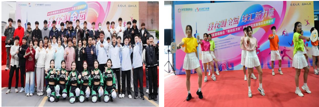
图 2 学生进行社会服务

团队组织“乡健逐梦”等“三下乡”突击队，深入社区开展体育、美育志愿服务 310 余场，惠及青少年以及留守儿童 4.8 万余人次，获乡镇政府及群众高度好评。体育教师为中国大学生足球锦标赛、省跆拳道锦标赛、大湾区排舞邀请赛等国家级、省级赛事提供社会实践服务 20 余场，与广东金钟少年宫教育发展有限公司、凡华力康复运动中心等 8 家企业制定“颈肩康复运动包”等三门课程，提升职工健康意识，覆盖 1.1 万余人次。